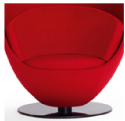
Tulip, Marcel Wanders per Cappellini