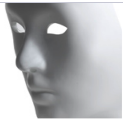
Nemo, Fabio Novembre per Driade

IDEA, che è patrocinata dalla prestigiosa associazione Federlegno Arredo, si svolgerà in concomitanza con due dei più importanti eventi europei di design che si tengono a Londra: il London Design Festival, caratterizzato da una serie di eventi di design in location di tutta la città, dal 18 al 26 settembre, e la fiera 100% Design London che si svolgerà dal 23 al 26 settembre presso il Centro espositivo di Earl's Court.