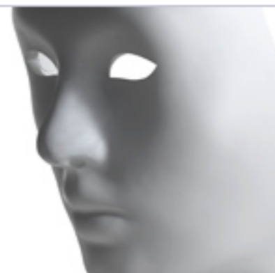
Nemo, Fabio Novembre per Driade