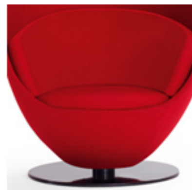
Tulip, Marcel Wanders per Cappellini